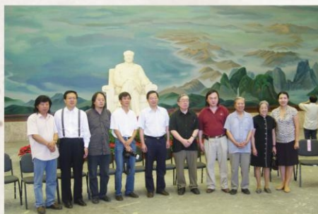
2003年8月2日，艺术设计系参与毛主席纪念堂大型壁毯项目

2003年，学校师生参与完成了清华大学美术学院主持的“毛主席纪念堂大型绒绣壁毯”科研项目。