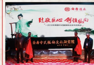
2016年11月19日，山东轻工职业学院舜唐中式服饰文化研究院揭牌仪式

2016年11月19日，为了更好的传承、发扬中华民族传统服饰文化，山东轻工职业学院纺织服装工程系与淄博舜唐家纺布艺文化有限公司共同成立“舜唐中式服饰文化研究院”，进行传统服饰研发、产品款式设计。