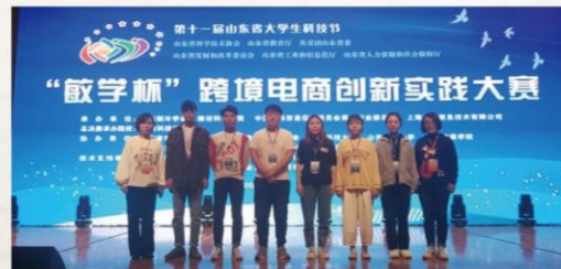
2019年10月，商务贸易系团队分获“跨境电商阿里巴巴国际站实战实训平台”与“跨境电商wish 实战实训平台”团体一等奖