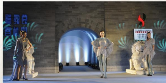
学生作品《灰韵》荣获“2012 第二届全国高等院校服装类专业教学成果展示活动大学生服装设计大赛”金奖

为切实提高学生的专业素质和动手能力,学校不断改革和优化实践教学体系,强化学生技能培养。学校先后获得“山东省职业教育示范实训基地”、“职业技能鉴定先进单位”、“山东省服装行业人才培养贡献奖”、“山东省电子信息行业职业技能鉴定先进实训基地”、“中国纺织行业建设示范院校”等称号。2007年,学校组织首批高职专业学生外出参加各类对口技能比赛。全面落实以赛促教、以赛促学精神,开启了外出参赛并获奖的序幕。