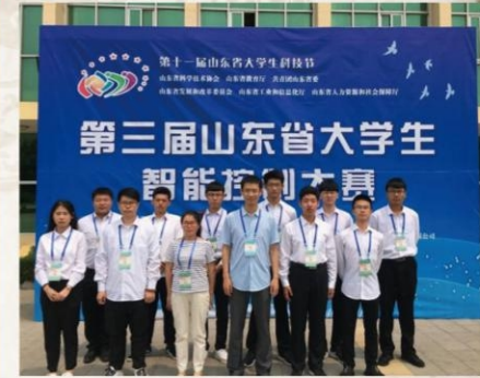
2019年6月，机电工程系3D打印社团在第三届山东省大学生智能控制大赛上获得3D打印项目一等奖