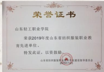
2019 年度山东省纺织服装职业教育先进单位

山东轻工职业学院位于“中国丝绸之乡”、“中国纺织产业基地”——淄博市。学校因服务地方经济而兴办,随着区域经济发展而发展。