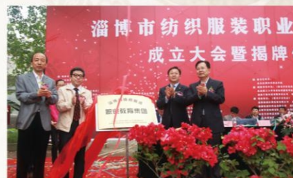
2011年5月9日，学院牵头成立淄博市纺织服装教育集团

2011年5月9日，学校牵头组建的淄博市纺织服装职业教育集团在山东丝绸纺织职业学院正式成立。学校共团结淄博市纤维纺织产品监督检验所、山东理工大学鲁泰纺织服装学院等13所学校、鲁泰纺织股份有限公司、淄博大染坊丝绸集团有限公司等90所企业共同加入，山东省教育厅党组成员、总督学徐曙光，淄博市委副书记韩国祥，中国纺织服装教育学会会长倪阳生，山东省纺织工业协会会长夏志林等出席。