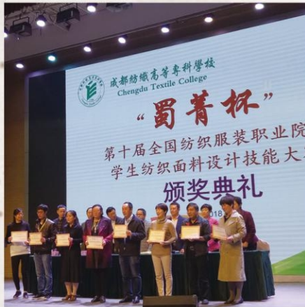
2018年10月19日，纺织服装工程系在“蜀菁杯”第十届全国纺织服装职业院校学生纺织面料设计技能大赛中获一等奖